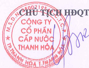
Lê Thế Sơn

- Nội dung thông tin cần công bố Và các tài liệu có liên quan.