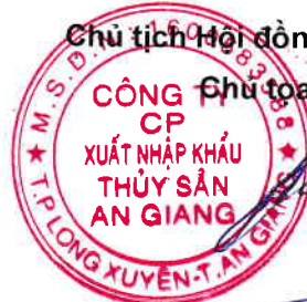
Châu Duy Cường