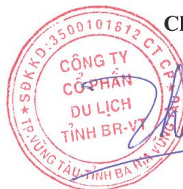
THÁI HOÀNG THÂN