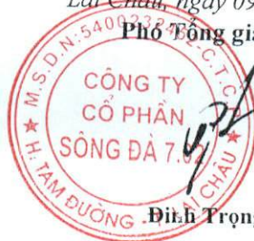
Đinh Trọng Thế