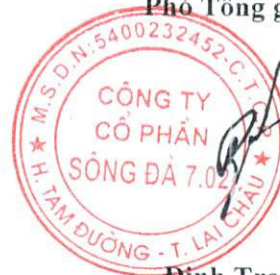
Đinh Trọng Thể