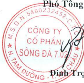
Đinh Trọng Thế