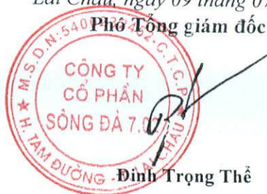
Đinh Trọng Thử