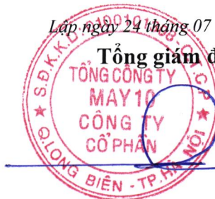
Thân Đức Việt