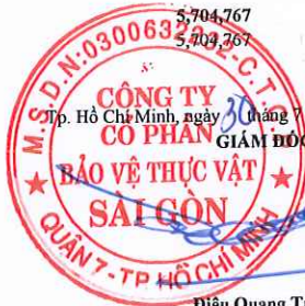
Điều Quang Trung