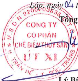
Lý Bích Quyên