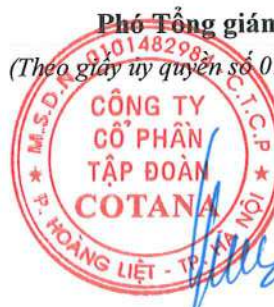
Đinh Thị Minh Hằng

(Các thuyết minh từ trang 10 đến trang 41 là bộ phận hợp thành của Báo cáo tài chính riêng giữa niên độ này)