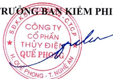
Thái Phong Nhã