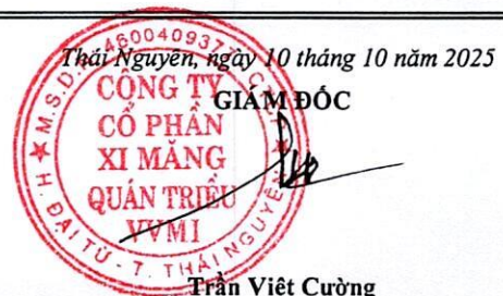
Trần Việt Cường