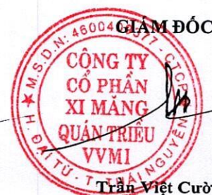
Trần Việt Cường