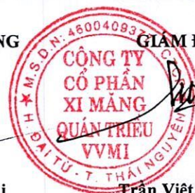
Trần Việt Cường