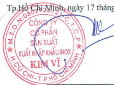
Đỗ Hùng Chủ tịch Hội Đồng Quản Trị