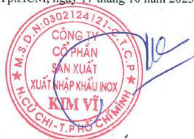
Đỗ Hùng Chủ tịch Hội Đồng Quản Trị