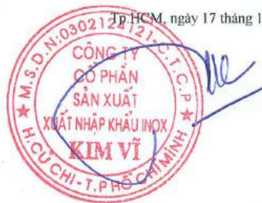
Đỗ Hùng Chủ tịch Hội Đồng Quản Trị