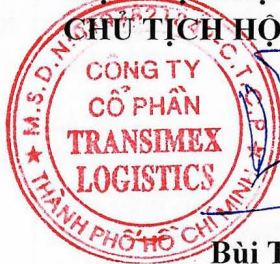
Bùi Tuấn Ngọc

Việc kiểm phiếu được kết thúc vào lúc 16 giờ 30 phút cùng ngày dưới sự giám sát của Ban Giám sát kiểm phiếu, được tất cả các thành viên của Ban kiểm phiếu đồng ý 100% nội dung và cùng nhau chịu trách nhiệm về tính chính xác, trung thực của Biên bản kiểm phiếu này và cùng đồng ý ký tên bên dưới.