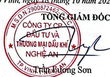
Trần Lương Sơn