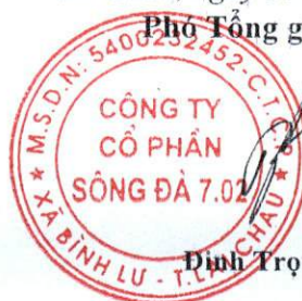
Đinh Trọng Thề