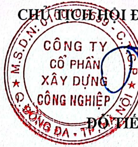
ĐO TIỀN LỢI