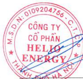
Phan Thành Đạt Chủ tịch Hội đồng quản trị