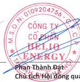
Phan Thành Đạt Chủ tịch Hội đồng quản trị