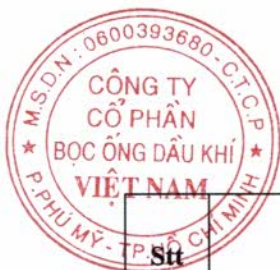
Bảng 1. Danh sách người có liên quan của Công ty. (Đính kèm Báo cáo tình hình quản trị Công ty năm 2025)