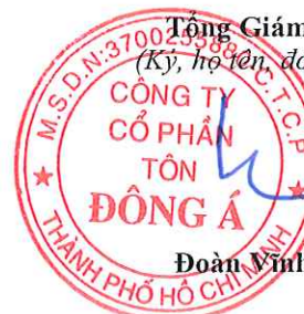
Đoàn Vĩnh Phước