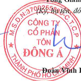
Đoàn Vĩnh Phước