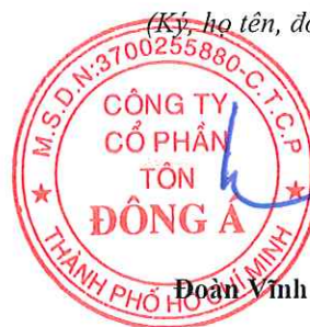
Đoàn Vĩnh Phước