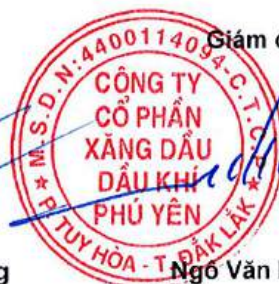
Ngô Văn Nhiệm

Các thuyết minh từ trang 9 đến trang 39 là bộ phận hợp thành của Báo cáo tài chính