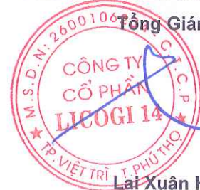
Lại Xuân Hùng