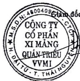
Trần Việt Cường