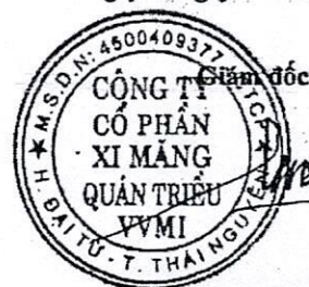
Trần Việt Cường