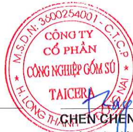
CHEN CHENG JEN

Chủ tịch Hội đồng Quản trị Đồng Nai, ngày 25 tháng 3 năm 2026