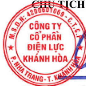
Nguyễn Cao Ký