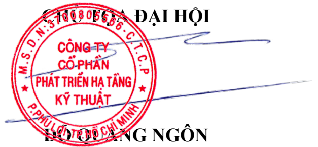
ĐẠI HỘI ĐỖ QUANG NGÔN