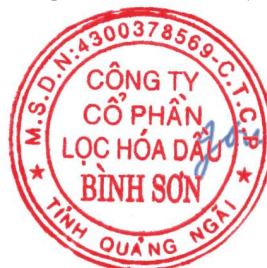
BUI NGOC DUONG