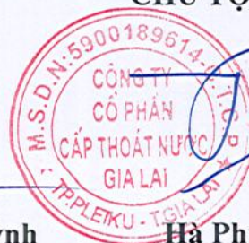
Hà Phước Tuấn