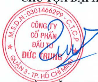
TRẦN ĐĂNG QUÂN