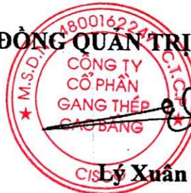
Lý Xuân Tuyền