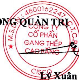
Lý Xuân Tuyên