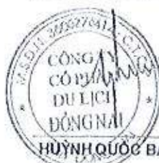
HUYỀN QUỐC BẢO