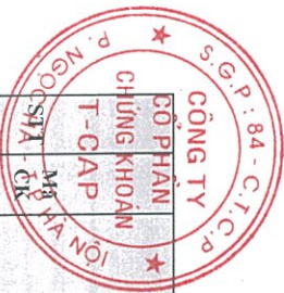
Phụ lục: Danh sách người có liên quan của người khai