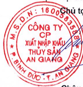
Châu Duy Cường